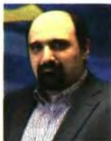
Του Χρήστου Τριαντόπουλου*

Τέλος, ο τέταρτος άξονας είναι η επικαιροποίηση των τιμών ζώνης από πιστοποιημένους εκτιμητές του μητρώου του υπουργείου Οικονομικών, η αναπροσαρμογή, δηλαδή, των αντικειμενικών αξιών.