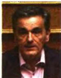
Του Ευκλείδη Τσακαλώτου*

Το ταμειακό απόθεμα το δημιούργησε η προηγούμενη κυβέρνηση ως μαξιλάρι ασφαλείας για να εξασφαλιστεί η πρόσβαση της χώρας στις χρηματαγορές, για την ομαλοποίηση της οικονομίας, την αποφυγή διακυμάνσεων, θέτοντας τις βάσεις για μια βιώσιμη ανάπτυξη.